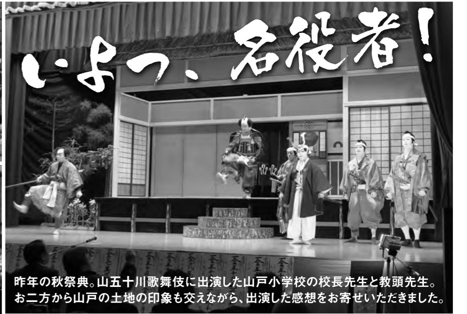
昨年の秋祭典。山五十川歌舞伎に出演した山戸小学校の校長先生と教頭先生。お二方から山戸の土地の印象も交えながら、出演した感想をお寄せいただきました。