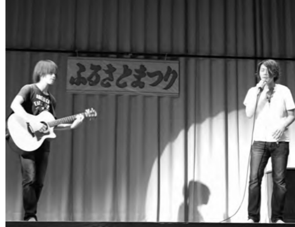
夏祭り。生憎の雨で屋内での開催となりましたが、 「NORE」が会場を盛り上げる!(8月13日)