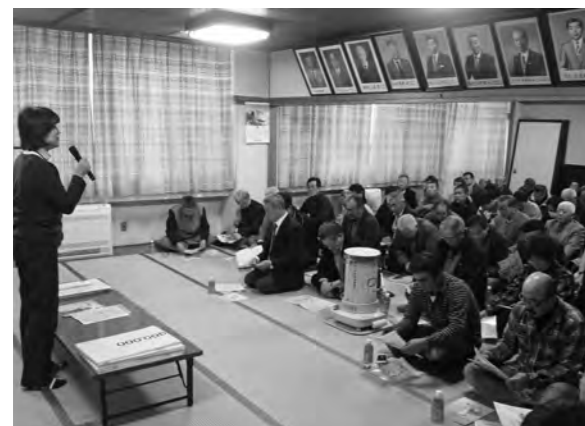
一日研修会。「特殊詐欺に合わないよう」 お互い声を掛けて気をつけましょう!(2月1日)