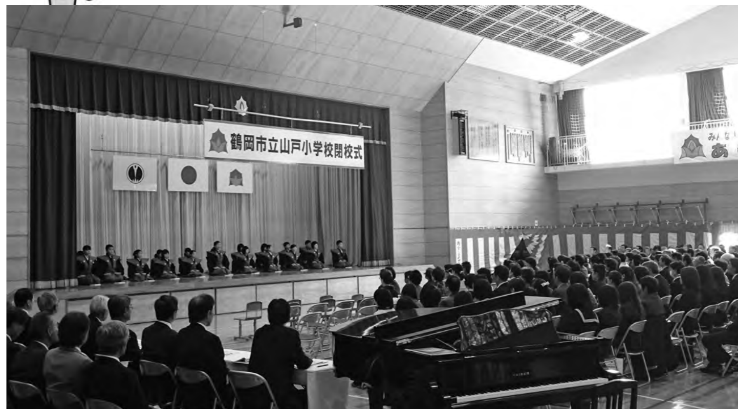
山戸小学校閉校式。大勢の同窓生、先生方、地域の方が集まり感動あふれる式典となりました。全校児童によるお誂いの様子。(10月25日)