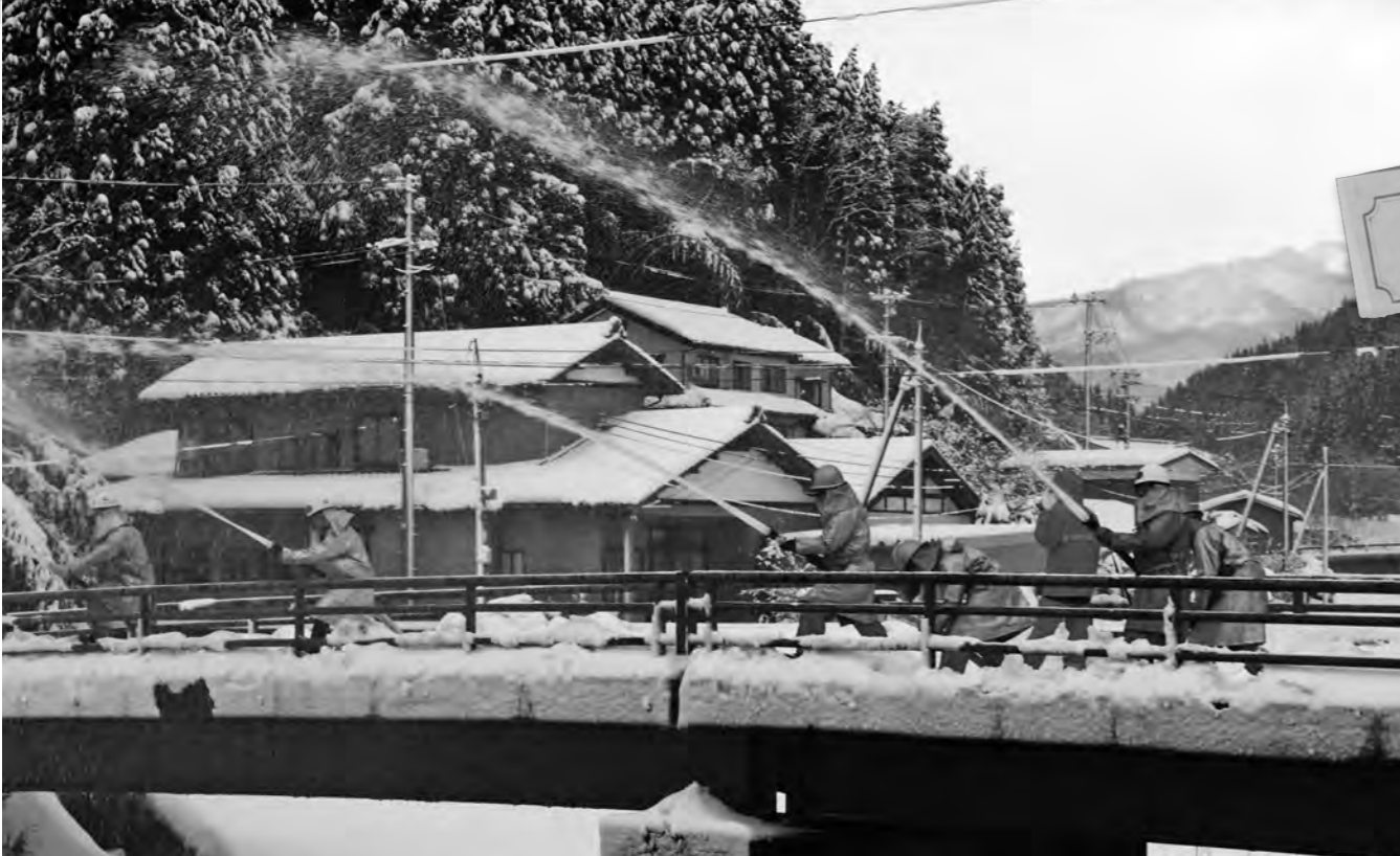
村の安全を守ります!毎年恒例の出初式。一年の無火災・無災害の願いを込めて。(1月2日)