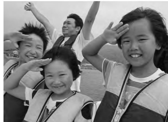
わくわく宿泊体験! 船長、出港いたします!爽やかな風を受けながら夏を満喫。(8月1日)