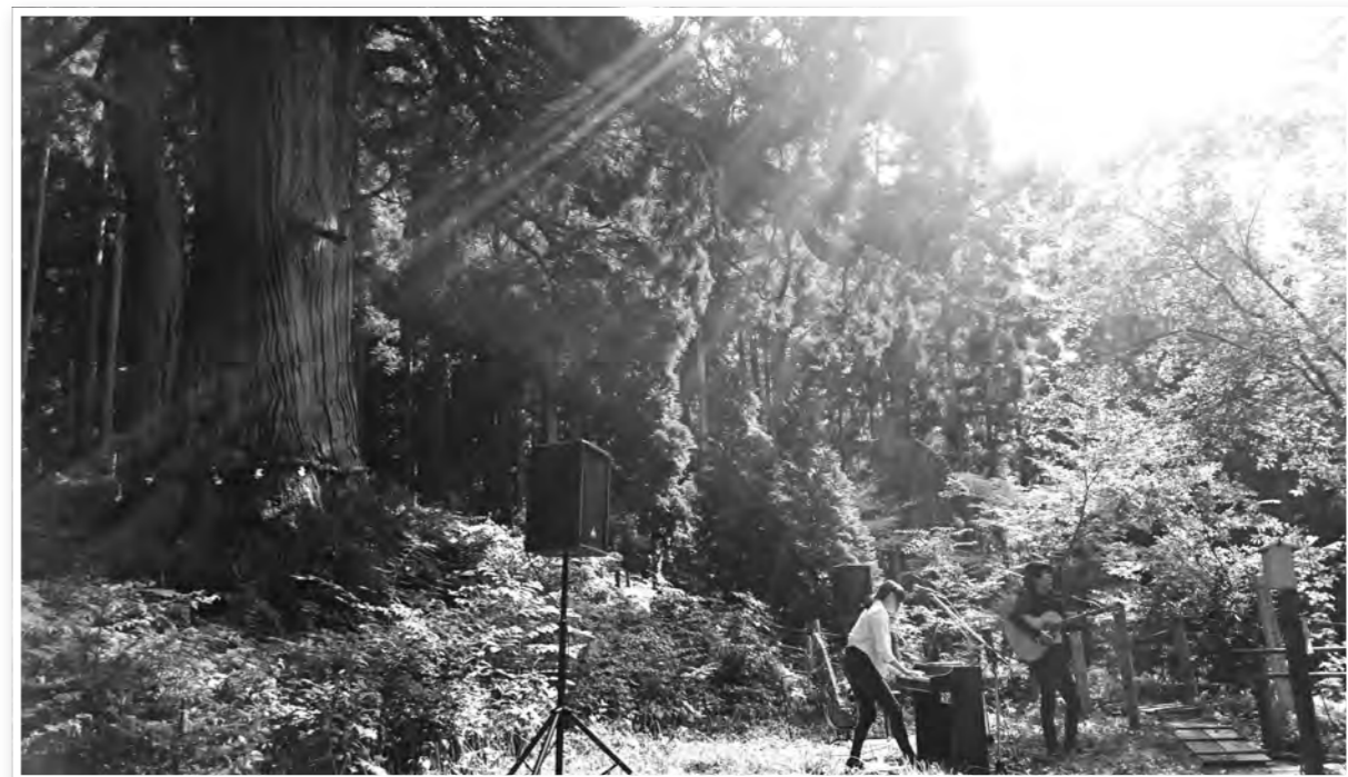
玉杉 奉納演奏会。ブルースギターとピアノの美しい音色。まるで玉杉と会話をするような幻想的な雰囲気でした ※背表紙のまちがいさがしもこの様子がモチーフになっています。(9月12日)