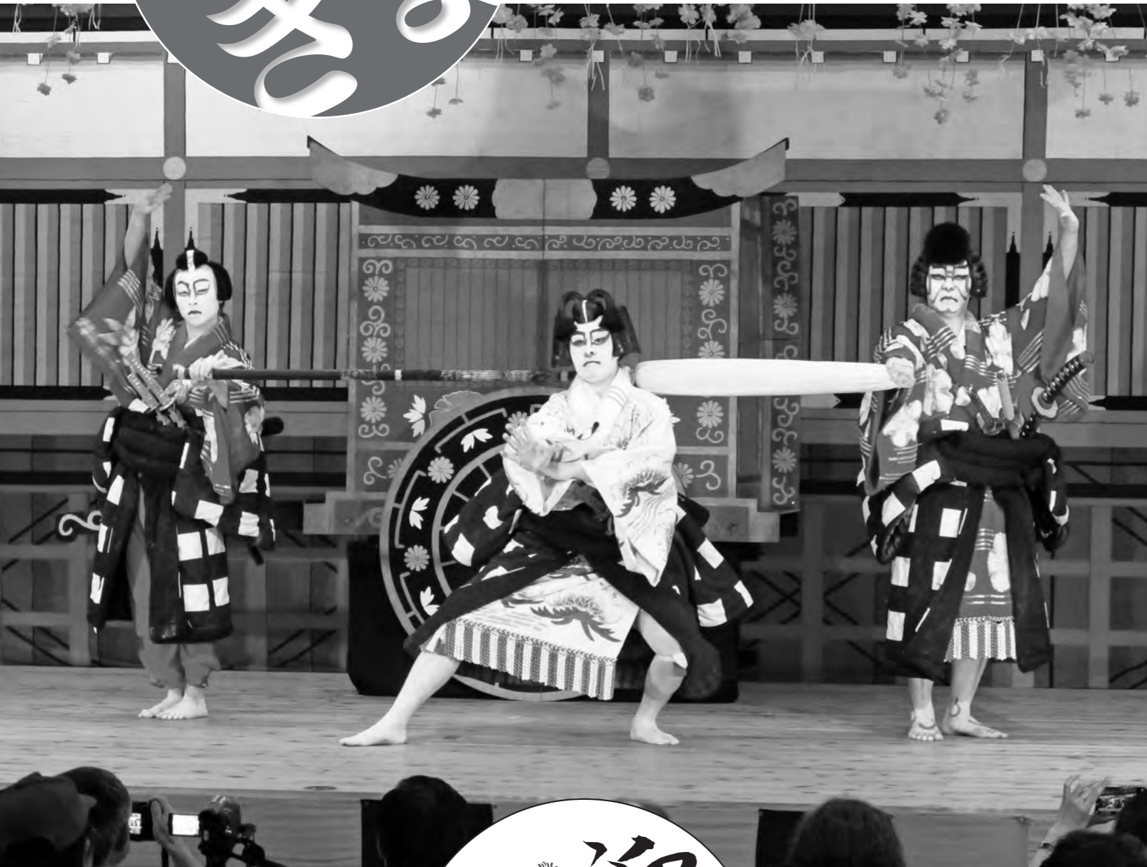
春祭典「山五十川歌舞伎」 菅原伝授手習鑑「吉田社頭車曳きの場」(H27.5.3)